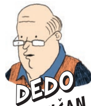
DEDO PRAKTIČAN I NEPOSREDAN