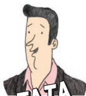
TATA SPORTSKA ZVIJEZDA U POKUŠAJU