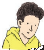
MAKS MLAD I LUD